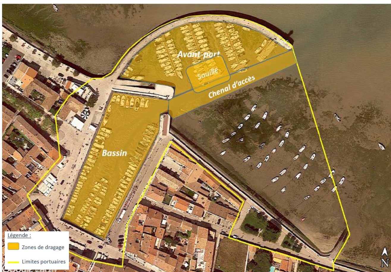
Zones de dragage autorisées dans le port (en orange)